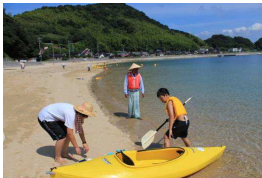
▼海水浴&カヌー体験