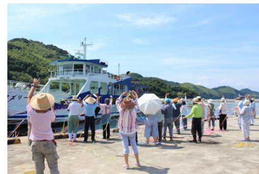
▼お別れ～船と紙テープ～