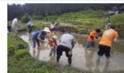
農業体験を通じた交流