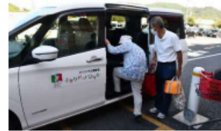
日常を支える移動支援