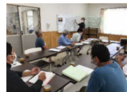
地域における話し合い